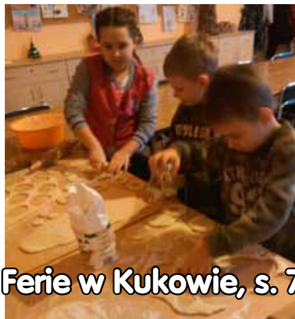
Ferie w Kukowie, s. 7