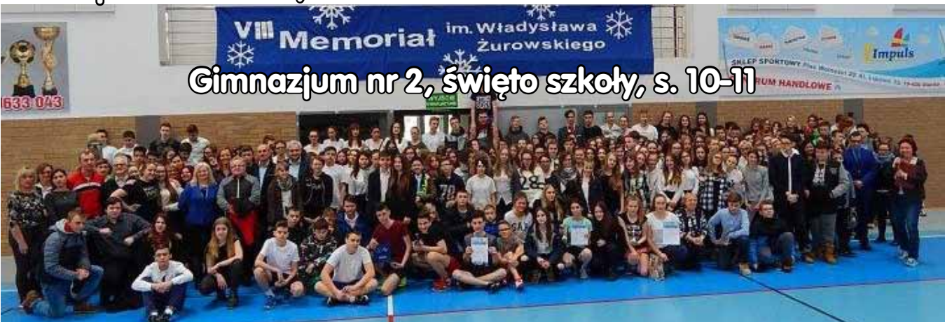
Gimnazjum nr 2, święto szkoły, s. 10-11