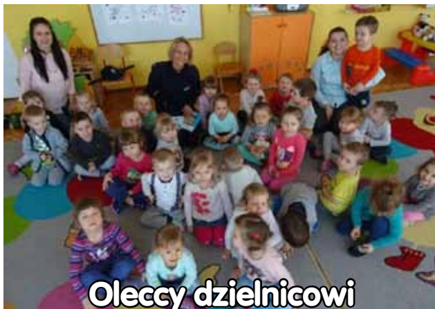
Oleccy dzielnicowi blisko społeczeństwa, s. 9

Firma „IBATUR” postanowiła uczcić tysięczne wydanie „Tygodnika Oleckiego” uczcić ufundowaniem czterech biletów na weekendowy wyjazd luksusowymi autobusami tej linii pasażerskiej do Brukseli. Szczegóły na s. 4