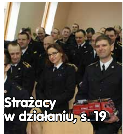
Strażacy w działaniu, s. 19