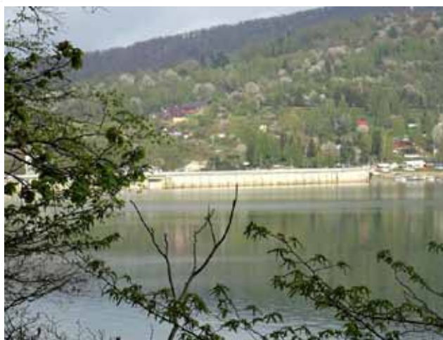
Wyjazd weekendowy: 28.04-2.05.2017 r. Trasa: Olecko - Rzeszów - Sanok - Bieszczady - Solina

Zapora wodna w Solinie (województwo podkarpackie) ma wysokość 81,8 m, długość 664 m i jest najwyższą budowlą hydrotechniczną i zaporą w Polsce. Tama utworzyła jezioro o pojemności 474 mln m 2 , powierzchni ponad 2100 ha oraz maksymalnej głębokości 60 m, objęło ono 27 km długości rzeki San oraz 14 km Solinki. Przy zaporze znajduje się hydroelektrownia wodna szczytowo-pompowa z czterema turbospełnami typu Francisa o mocy 200 MW i produkcji rocznej 112 GWh. Średni przepływ w Sanie na wysokości zapory wynosi 19,6 m 3 /s.