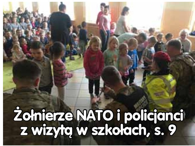
Żołnierze NATO i policjanci z wizytą w szkołach, s. 9