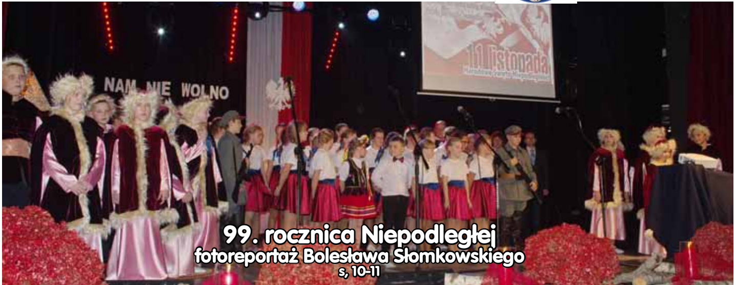
99. rocznica Niepodległej fotoreportaż Bolesława Słomkowskiego s. 10-11