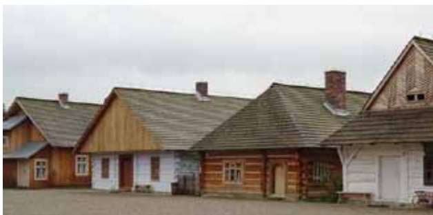
Wyjazd weekendowy: 28 kwietnia - 2 maja 2017 r.

Trasa: Olecko - Rzeszów - Domaradz - Blizne - Stara Wieś - Brzozów - Jurowce - Sanok