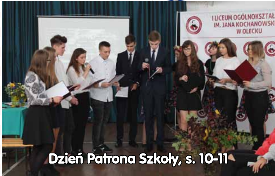
Dzień Patrona Szkoły, s. 10-11

Hurtownia w Olecku oferująca produkty techniki grzewczej i sanitarnej przenosi się na ulicę Armii Krajowej 30a\ok.2