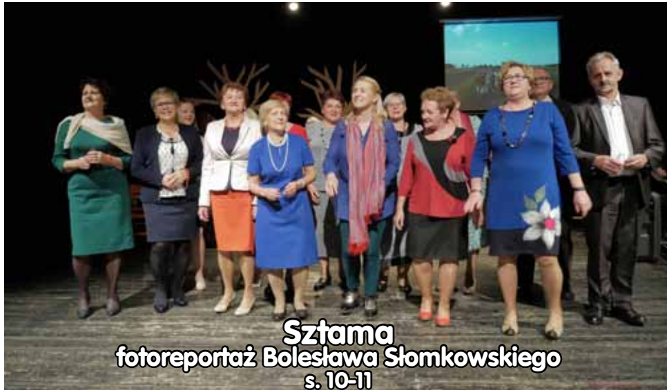
Sztama fotoreportaż Bolesława Słomkowskiego s. 10-11