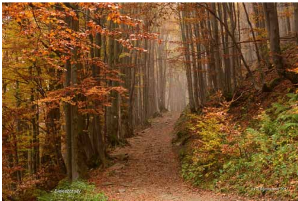
Jeśień 2017 w Bieszczadach - na poloninę Wetlińską