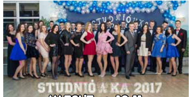
STUDNIÓWKA 2017 WZSLIZ, s. 10-11