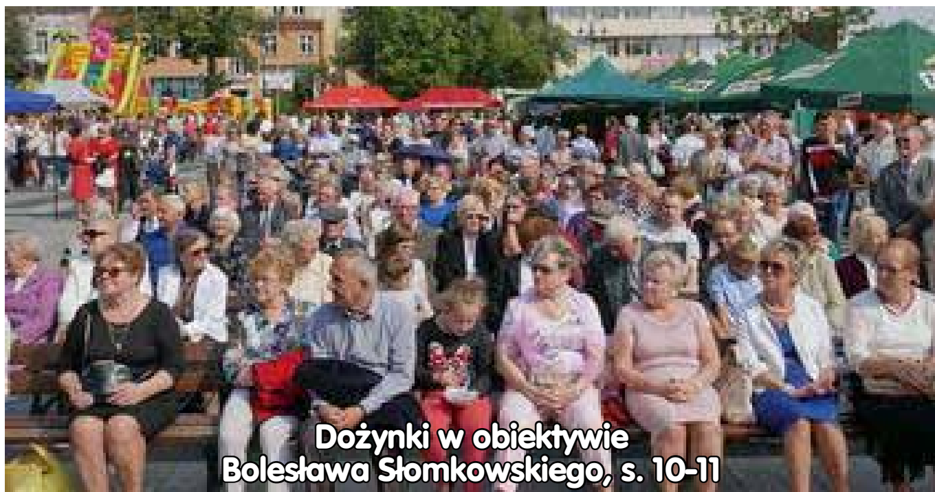
Dożynki w obiektywie Bolesława Słomkowskiego, s. 10-11