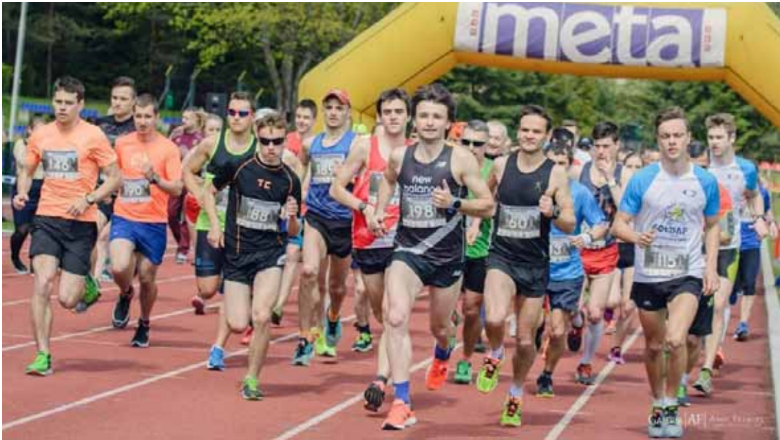
Międzynarodowa Olecka Trzynastka 2017 w fotografi Adama Falęckiego