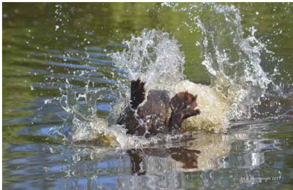
Bobrowe salto mortale