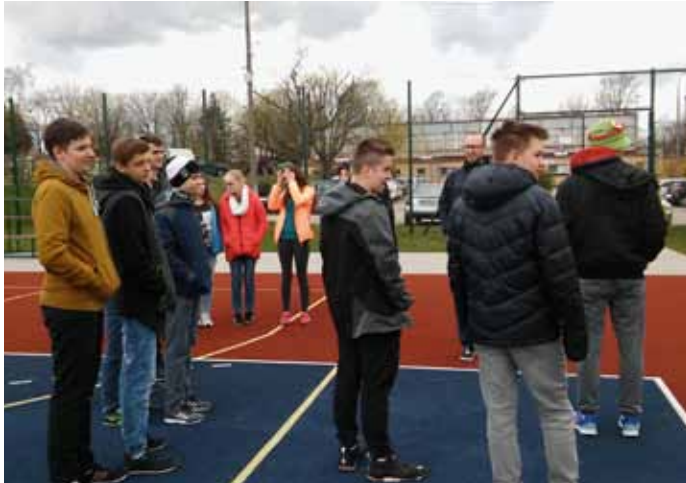
wycieczka edukacyjna, s. 6