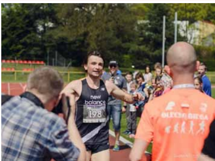
Międzynarodowa Olecka Trzynastka 2017, s. 9