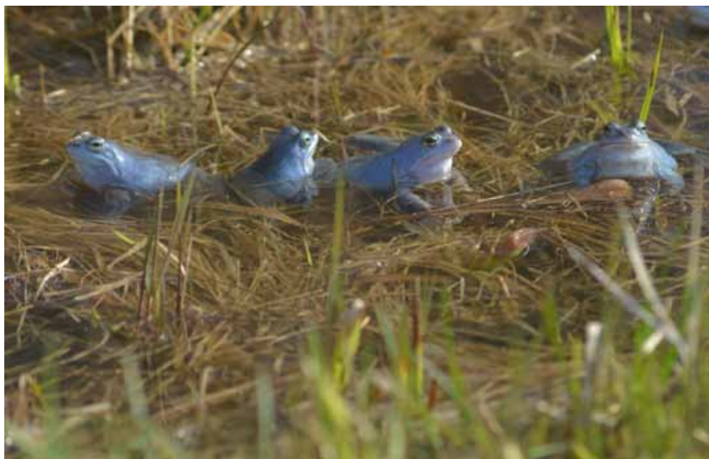
Miało być zielono