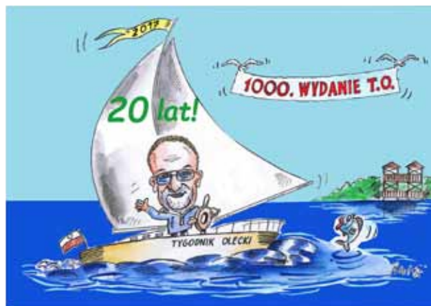
Rysunek Waldemara Rukścia z okazji 1000. wydania „Tygodnika Oleckiego”