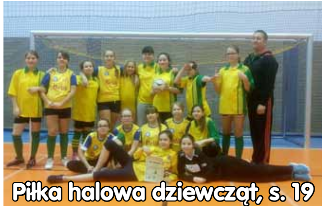
Piłka halowa dziewcząt, s. 19

biuro: (85) 7 404 404 infolinia: 795 404 404 www.ibatur.pl