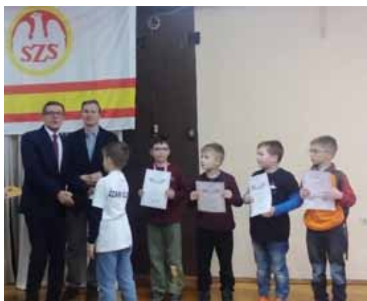
15 listopada w Nowym Mieście Lubawskim rozegrano Indywidualne Mistrzostwa Województwa SZS.

Zawody podzielono na grupy wiekowe: szkoły podstawowe klasy I-III, szkoły podstawowe klasy IV-VI, gimnazja oraz szkoły ponadgimnazjalne.