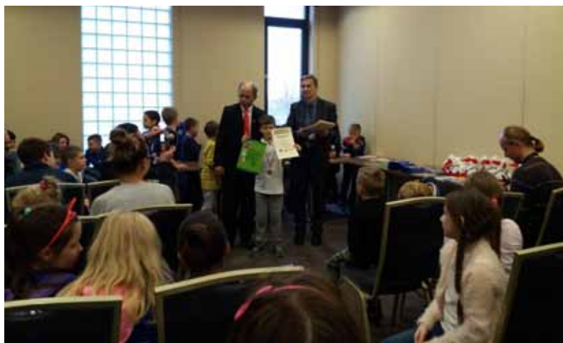
12 listopada w Olsztynie rozegrano I Turniej szachowy Dla Dzieci i Młodzieży z Okazji Święta Niepodległości o

Puchar Warmińsko-Mazurskiego Kuratora Oświaty.