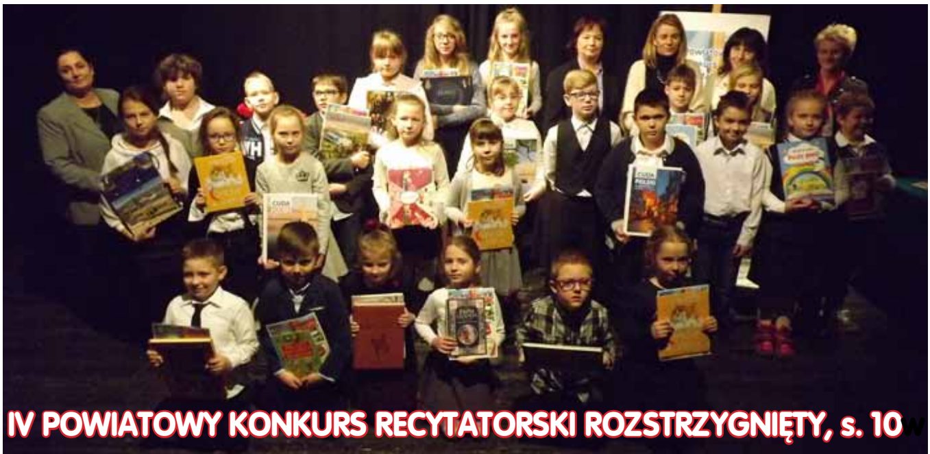
IV POWIATOWY KONKURS RECYTATORSKI ROZSTRZYGNIĘTY, s. 10