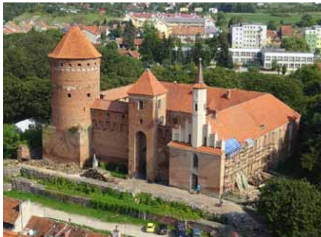
Trasa: Olecko - Banie Mazurskie - Korsze - Reszel

Reszel. Niewielkie miasto warmińskie (około 5 tys. mieszkańców) w powiecie kętrzyńskim, należące do sieci cittaslow , z dużą ilością zabytków.