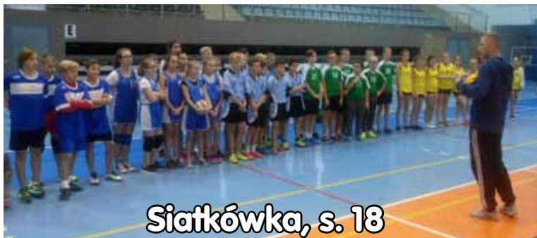
Siatkówka, s. 18