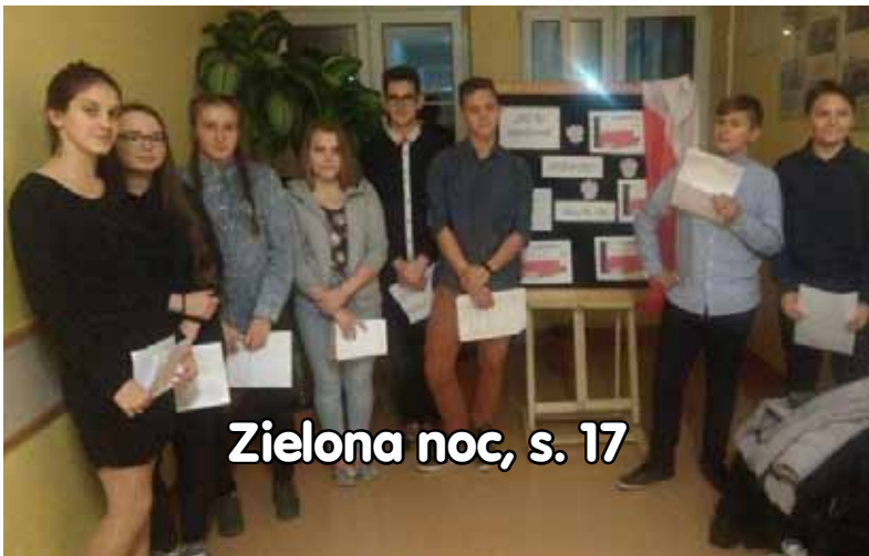
Zielona noc, s. 17