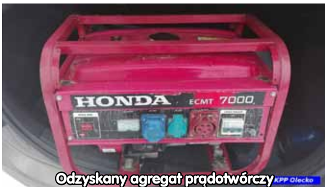
Odzyskany agregat prądowłóczy KPP Olecko