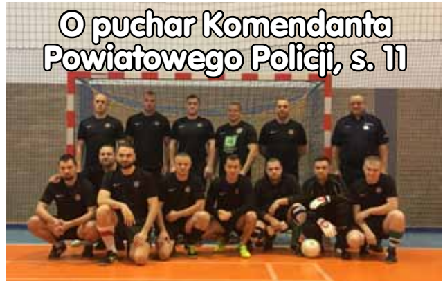
o puchar Komendanta Powiatowej Policji, s. 11

Autokary klasy LUX/darmowa kawa/herbata/słodkie przekąski/bezplatny dostęp do internetu Wifi.