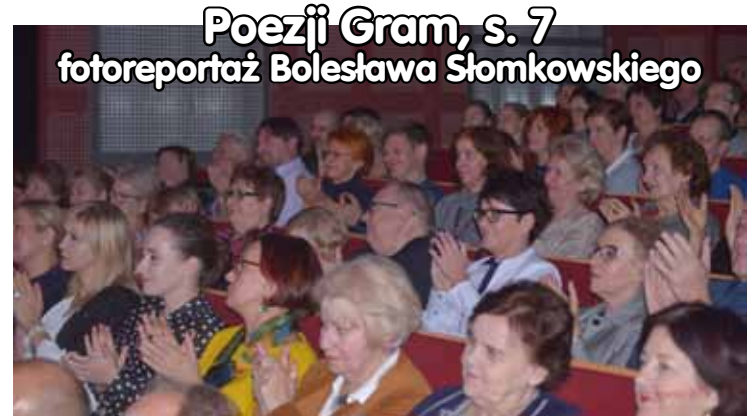
Poezji Gram, s. 7 fotoreportaż Bolesława Słomkowskiego

chleb swojski, ciasta, wypiek, tel. 605-107-755 B46706