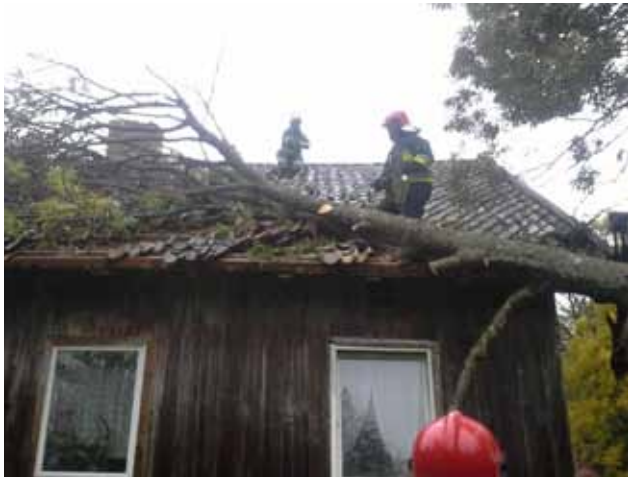
Strażacy usuwają w Golubiach powalone na budynek mieszkalny drzewo

Informacji udzielił aspirant Andrzej Zajkowski