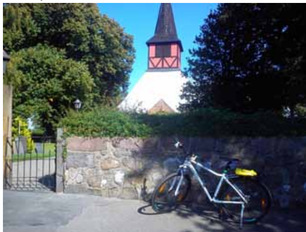
Przed kościółkiem w Hasle

Bornholmska przygoda się kończy. Trzeba spać. Jutro jeszcze 35 km i plaże w Dueodde i Balka, Najbardziej znane, z wydm.