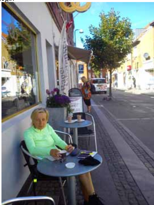
Kawa w Nexo

I była! Z rybą i piwem. Bez względu na cenę jednego i drugiego.