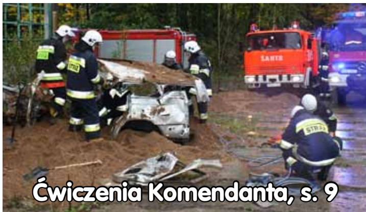
Ćwiczenia Komendanta, s. 9

chleb swojski, ciasta, wypiek, tel. 605-107-755 B46701