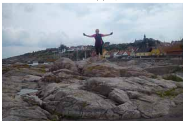
Na skałach w Gudejem