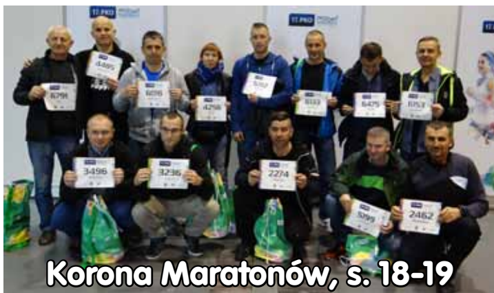
Korona Maratonów, s. 18-19

chleb swojski, ciasta, wypiek, tel. 605-107-755 B46701