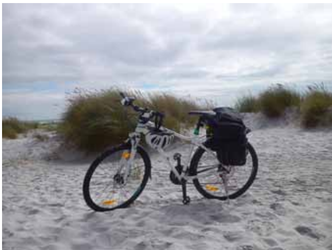
Plaża w Dueodde