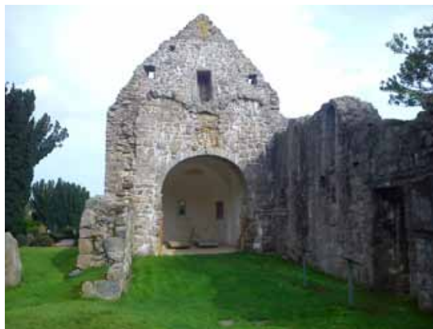
Ostermarie, ruiny przy kościele

Trochę postraszył nam deszcz zanim tu dotarliśmy. Na postoju, gdzie popijaliśmy herbatę, zatrzymały się warszawianki. Chcą dzisiaj objechać całą wyspę, czyli na naszą ocenę, około 120 km. Wariatki!