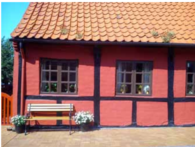
Domek w Hasle