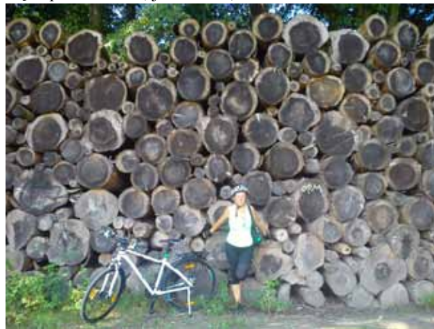
Las pod Allinge. Skład drzewa.

Jeszcze 15 km, a zaczyna padać deszcz. Nie lubię deszczu tego lata. Boję się, że zimno odbierze mi siły i motywację. W lesie nakładam pelerynę. Dwóch młodych mężczyzn, jedynych, których mijamy na tym odcinku przez las i pola, zatrzymuje się i dopytuje, czy potrzebna jest pomoc. Po zapewnieniach, że nie, pytają, skąd jesteśmy i czy nam się tu podoba. Och, jak bardzo, bardzo!