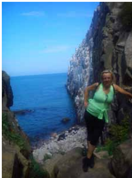
Klify obok Jonas Kapel

Zachwycają mnie detale: okna, ozdóbki, kwiaty. Domy są pomalowane na wszystkie kolory świata.