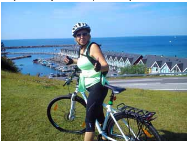
Marina tuż za Hasle

Poczułam, że nadeszła chwila, by spróbować wędzonych ryb, o których tyle trują w przewodnikach. W wędzarni – sklepie drobna pinka o to, czy nie za drogo.