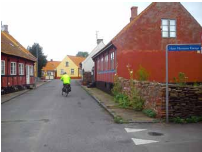
Objazd po uliczkach w Nexo

Wyjście z promu i lekka konsternacja: co dalej? Większość podróżujących promem udaje się na pobliski parking, gdzie czekają na nich trzy autokary. Zabiorą je na objazdową wycieczkę po wyspie. To takie popularne, jak się okazuje. Podśmujemy młodych Polaków z dzieckiem, którzy już tu wypoczywali i dopytujemy, w którą stronę mamy ruszać. Wskazują nam drogę do Ronne, ale postanawiamy zrobić rowerowy spacer po Nexo.