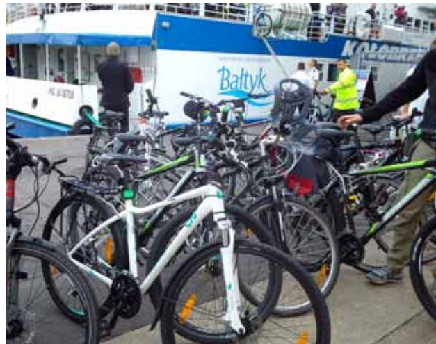
Bornholm, port w Nexo. Ten biały rower to mój

Z Koszalina przesiadka do Kołobrzegu bez większych problemów. Na dworcu są naganiacze, którzy oferują pokoje, ale my mamy już zamówiony. Docieramy do niego, ale okazuje się, że facet zrobił nam w jajo i nie mamy dachu nad głową. Jeździmy po mieście i dzwoniemy w różne miejsca, ale nikt nie chce nam wynająć na jedną noc. Deszcz już nie pada tylko leje. Przemoczyło nas, pomimo peleryn. Nie pytajcie, jak się czuję, bo pogryzę. Wracamy na dworzec PKP do naganiaczy. Mamy kwaterę w „norze”. Strzeliliśmy po lufie wiśniówki, bo bez tego gotowa jestem wracać jeszcze dziś o 23 – cieję do domu. Deszcz i i chłód pokonały mnie.