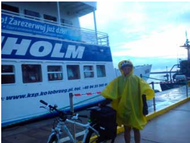
Port w Kołobrzegu, 6.30. Tak się zaczęła podróż