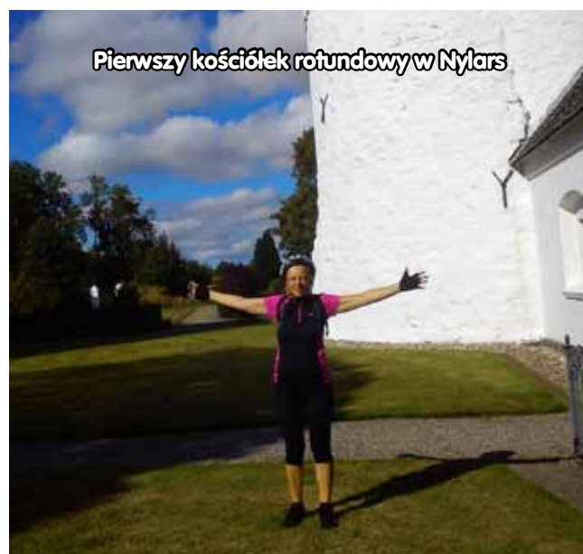
Pierwszy kościółek rotundowy w Nylars

Wszystko tu, na wyspie, jest jakby w zwolnionym tempie: samochody jeżdżą wolniej i jest ich o wiele, wiele mniej, ludzie nie pędzą tylko spacerują, ktoś przemknął po sklepie, nawet krojenie ciasta i nalewanie kawy przez reklamodawcę (ten od wyrobów drewnianych) jest celebrowaniem chwili. Nic, tylko żyć i delektować się życiem, choćby tylko przez te pięć dni, które sobie zafundowałam. Dlaczego tak późno tu trafiłam?