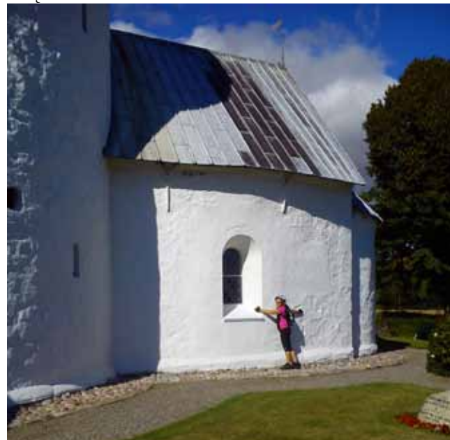
Dotykam historii (Nylars)

Trafiamy do kościółka i na cmentarz. Jak tu pięknie! Po raz kolejny udowadniam sobie, że na wyjazdach słońce za mną chodzi.