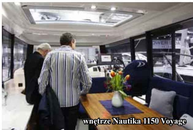
wnętrze Nautika 1150 Voyage

Głównym atutem jest wygoda samodzielnego prowadzenia, bezpieczeństwo, komfort żeglowania oraz osiągi.