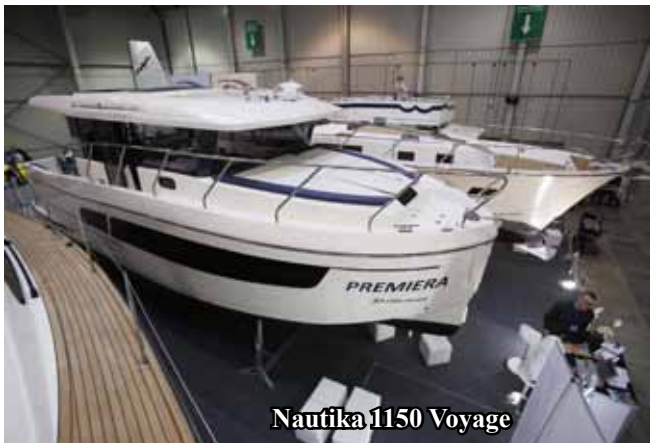
Nautika 1150 Voyage

Od 10 do 13 marca w Warszawie odbyły się targi „Wiatr i Woda 2016”. Delphia Yachts zaprezentowała na nich aż 6 jachtów żaglowych i motorowych. Zdobyła 5 nagród i wyróżnień.