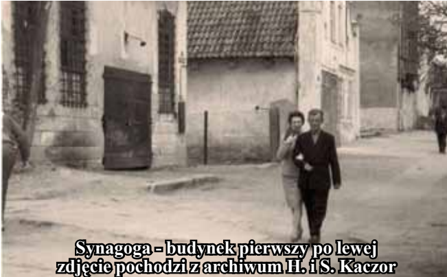
Synagoga - budynek pierwszy po lewej

Wielu z nas przechodzi obok bloku tzw.: „złotówki” czy też obok dawnej gorseciarni myśląc o istniejącym tam kiedyś cmentarzu żydowskim. Ci, którzy przybyli do Olecka tuż po wojnie, lub się w Olecku zaraz w latach powojennych urodzili, pamiętają jeszcze mur okalający niewielki cmentarz, kilka zapadających się już w ziemię nagrobków. Wiele osób mówi o powojennym szacunku do tego miejsca, ale cmentarz był i miejscem wypasu koni, jak i bawiły się tam dzieci, zaś niedługo chłopak na szkolnej przerwie zaciągnął się tam po raz pierwszy papierosem. Wspominał się piękne drzewa dające cień. Później nieliczne źródła mówią o planach rewitalizacji, rychło zaniechanych i koparkach oraz budowie nowego bloku, a jeszcze późniejsze, przekazywane półgębkiem, o macewach, które albo wylądowały na terenach podmokłych w okolicy dzisiejszej plaży zwanej Szyjką, albo o tych, które są w oleckich domach częścią utwardzającą deptaki do nich prowadzące. Ile z tego prawdy to wciąż nie wiadomo, wiele informacji wymaga jeszcze żmudnych poszukiwań i weryfikacji, ale historia cmentarza odsłania zapomnianą historię żydowskiej społeczności mieszkającej w Olecku, w czasach, kiedy miasto nazywało się Marggrabowa, a później Treuburg. Jakie były jej początki?