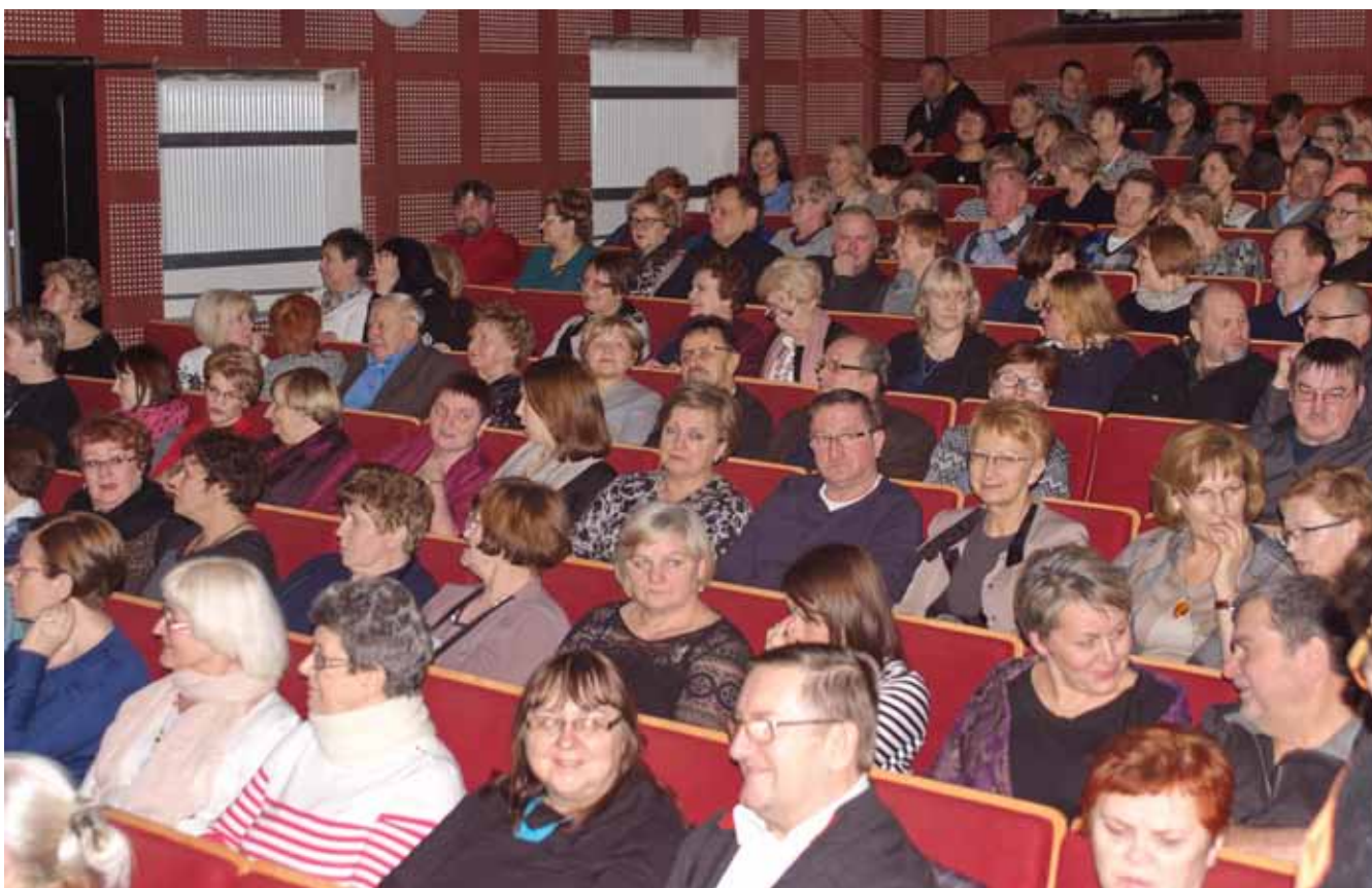
Koncert Grażyny Łobaszewskiej mini fotoreportaż Bolesława Somkowskiego