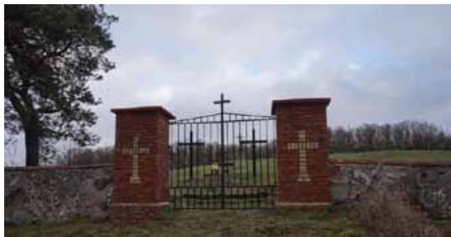
Dojazd: Olecko - Lenarty - Filipów.

Miejscowość Filipów położona jest w województwie podlaskim, w powiecie suwalskim, w gminie Filipów; 22 km od Olecka, zamieszkała przez ponad 2100 osób.