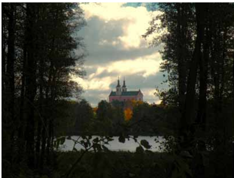
III miejsce, Amelia Kepisty (1c), Z drugiej strony

Gimnazjaliści zgłosili bardzo ciekawe fotografie prezentujące przyrodę lub dziedzictwo kulturowe Wigierskiego Parku Narodowego.