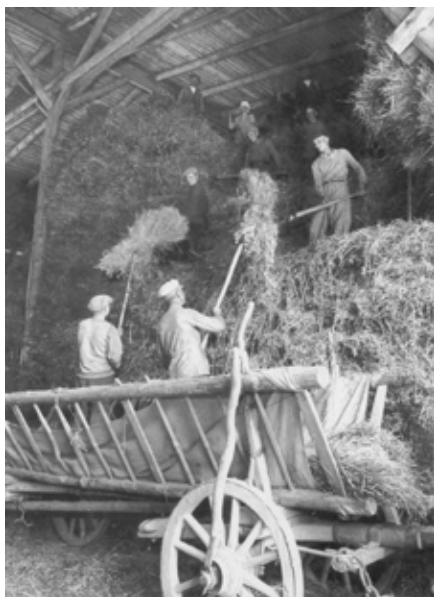
Lata 20. XX wieku. Zwózka siana

W 1930 powstaje 11 hektarowy ogród warzywny. W nim 200 metrowa szklarnia na pomidory oraz 60 metrowa hala przeznaczona na rozsadnik, w której na początku roku uprawiano ogórki. Było też ponad 200 okien inspekcyjnych.