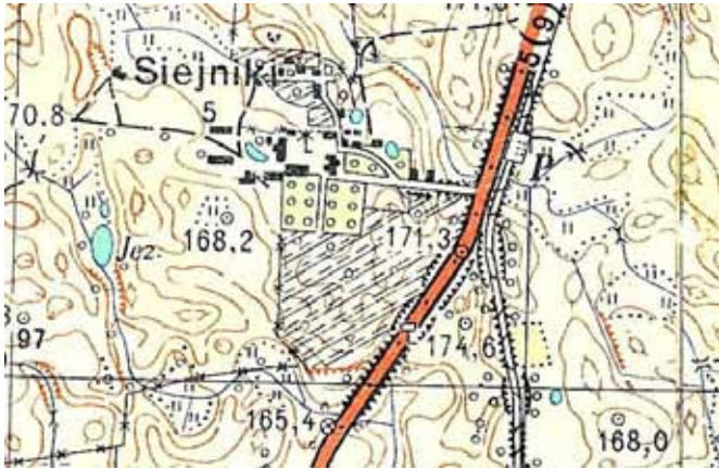
Mapa polska z 1950 roku