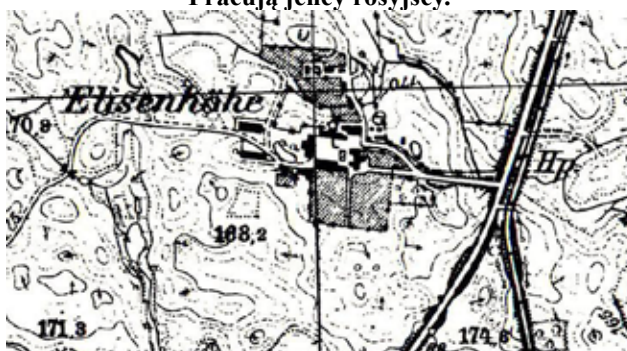
Mapa niemiecka z 1940

Ponadto gospodarstwo przyjmowało praktykantów ze szkół rolniczych i było uważane za jedno z najlepszych miejsc tego typu nauki. Stale przebywało 4 praktykantów. Dzięki wszechstronności produkcji otrzymywali oni gruntowne wykształcenie. Często też były wizytacje szkół i związków rolniczych. Na miejscu odbywały się egzaminy i testy praktykantów.