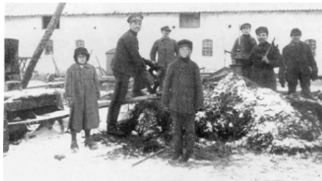
Zima podczas pierwszej wojny światowej. Pracują jeńcy rosyjscy.

Kontrole jakości hodowanych zwierząt przeprowadzała centralna uniwersytecka Komisja Rolnicza.