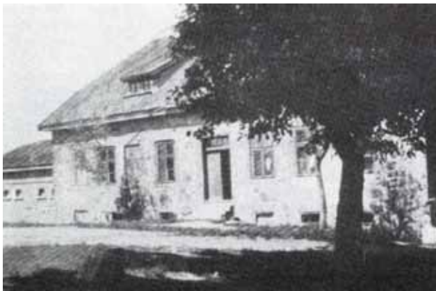
Budynek administracyjny w 1890

Na początku roku 1945 utworzono we dworku obóz przejściowy dla Niemców i Mazurów.