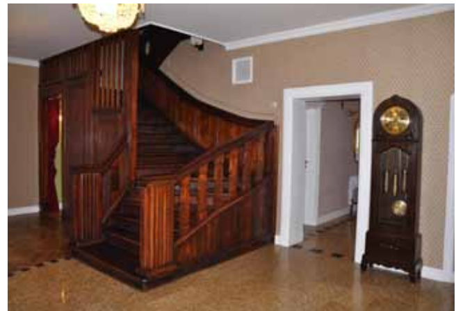
Hol główny Mazurskiego Dworu