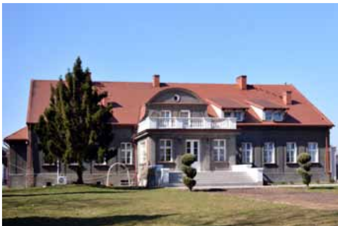
Mazurski Dwór 2015

opracował Bogusław Marek Borawski materiały archiwalne Józef Kunicki, B. M. Borawski dobór map, starych fotografii oraz fotografie współczesne Józef Kunicki