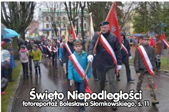
Święto Niepodległości fotoreportaż Bolesława Słomkowskiego, s. 11

AGR O MASZ ul. Zamostowa 10, tel. 87 523 00 20