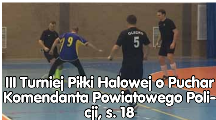
III Turniej Piłki Halowej o Puchar Komendanta Powiatowej Policji, s. 18

V oleckie zderzenia ze słowem i dźwiękiem