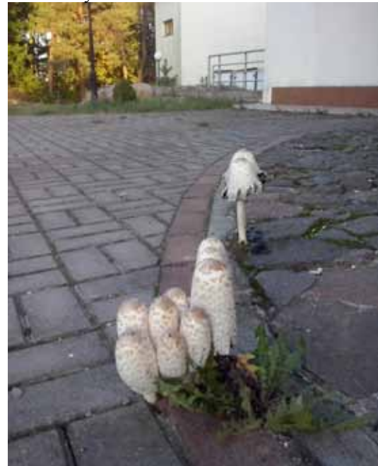
Grzyby rosną wszędzie. Szkoda, że niejadalne.