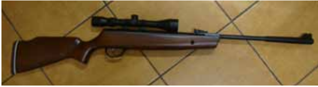
Wiatrówka odebrana przez policję

rubrykę redaguje rzeczniczka prasowa KPP młodsza aspirantka Justyna Sznel