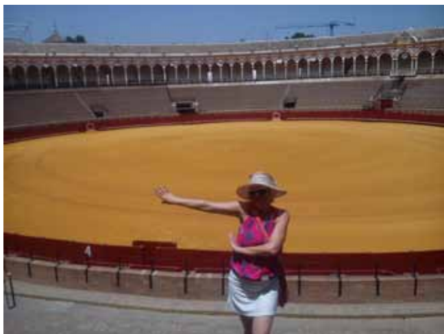
Plaza de Torres; dobrze, że nie wypuścili byków

Sevilla zwana patelnią Hiszpanii. Stąd wyruszył na podbój Ameryki Kolumb i tu jest jego grób w największej katedrze w Europie.