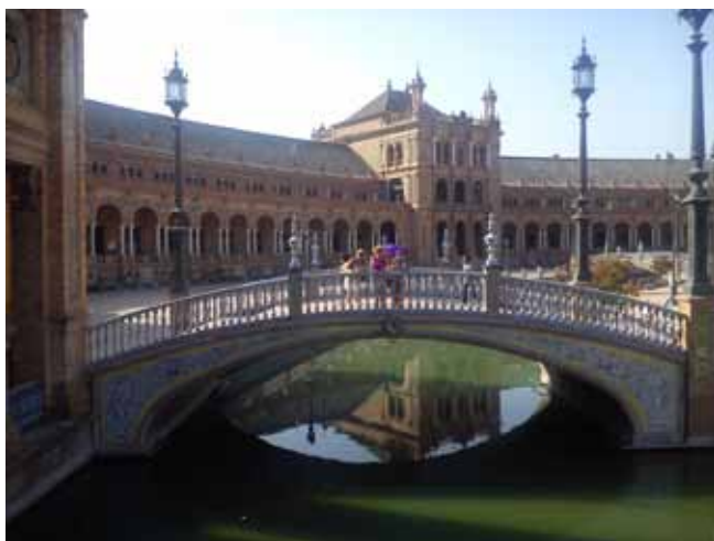
najbardziej romantyczny plac, Plac Hiszpański

Plaza de Toros de la Maestranza – najwspanialsza w Hiszpanii arena do walki z bykami. Korida to tradycja, sztuka, duma Hiszpanii, a z tym się nie dyskutuje. Byłam, siedziałam, oglądałam tylko pustą arenę, ale i tak robi wrażenie.