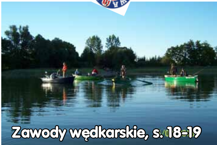
Zawody wędkarskie, s. 18-19