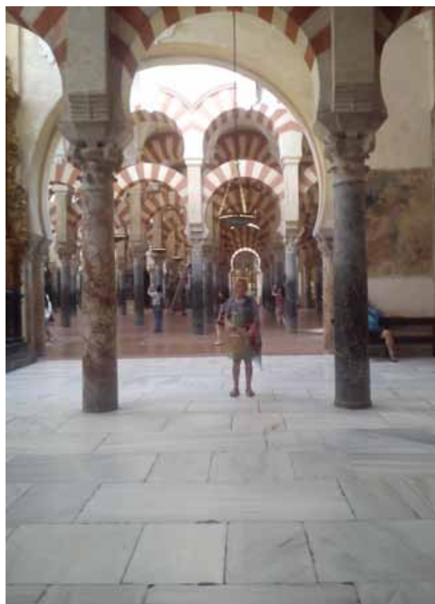
meczét Mazquita z setkami kolumn (a raczej katedra na bazie meczetu)

Nie ogarniam wielkości i piękna tej budowli i jak zwykle jestem pełna podziwu dla architektów, czyli potęgi ludzkiego umysłu.