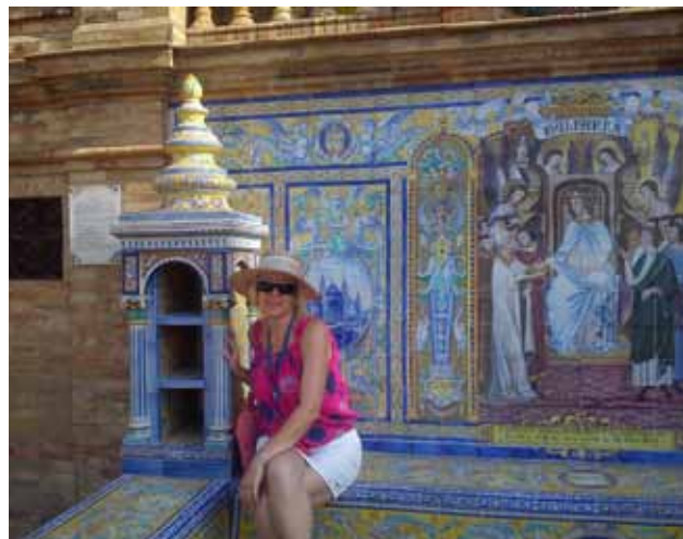
Biblioteka na Placu Hiszpańskim; zayś był taki, że każdy może poczytać tu książkę

Można wypożyczyć (za odpłatnością, oczywiście) łódkę i popływać wokół placu. To właśnie tutaj, na Placu Hiszpańskim rozgrywa się akcja słynnej opery Carmen Bizeta.