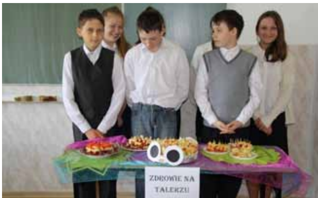
Szkoła Podstawowa w Stożnem – przygotowanie zdrowych przekąsek przez uczniów.

Poniżej zdjęcia z realizacji programu w niektórych szkołach.