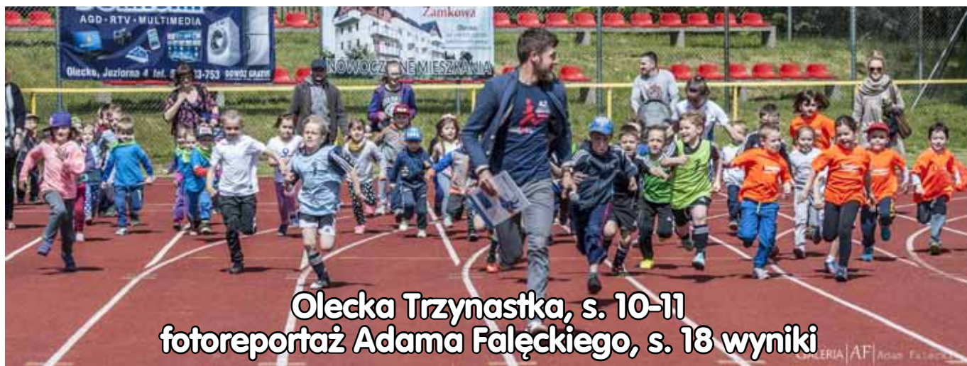
Olecka Trzynastka, s. 10-11 fotoreportaż Adama Fałęckiego, s. 18 wyniki