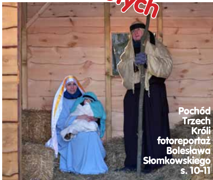
Pochód Trzech Króli fotoreportaż Bolesława Słomkowskiego s. 10-11