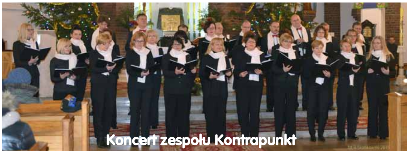
Koncert zespołu Kontrapunkt