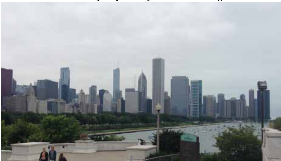
widok na port jachtowy i centrum Chicago