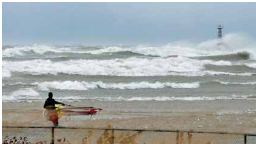
sztorm na jeziorze to gratka dla uprawiających windsurfing

Każda podróż kiedyś się kończy. Tak i mój pobyt też dobiegł końca. Niedziela od samego rana przebiegała na pakowaniu. Mogłem mieć w bagażu lotniczym 35 kilogramów i bagaż osobisty nie ma co prawda ograniczeń ale trzeba to do samolotu zatargać, potem gdzieś upchnąć, a w końcu i z samolotu wynieść. Udało nam się z tym bagażem idealnie, ale o tym później.