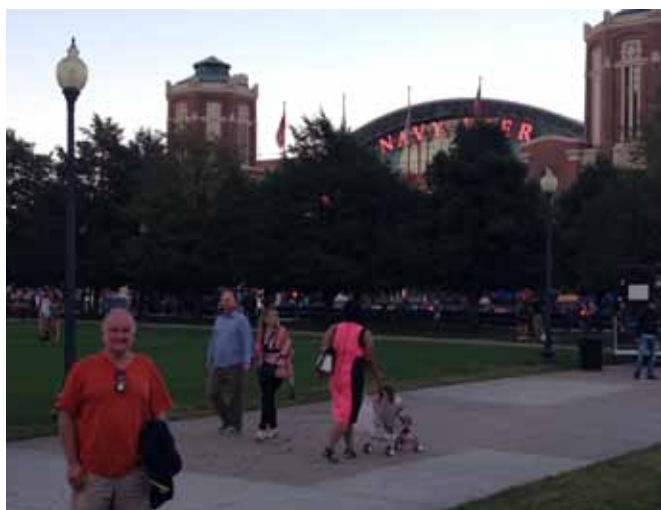
Przed wejściem do portowej mariny

Docieramy do centrum. Bart szuka miejsca, a właściwie wieżowca z parkingiem. Wjeżdżamy na czwarte piętro i tam dopiero znajdujemy wolne miejsce. Zjeżdżamy windą w dół i wychodzimy na ulicę, którą tłumy ciągną w kierunku portu. Różnorodność, różnorako ubrane i radosne. Na trawnikach siedzą młodzi ludzie, malują obrazy, jedzą frytki, piją Colę, rozmawiają. Jakaś wędrowną trupą cyrkową pokazuje sztuczki gimnastyczne. Kilka metrów dalej inny zespół bawi się z dziećmi w tworzenie wielkich baniek mydlanych. Jest patrol policji na koniach. Tłum rozmawia wszystkimi językami świata.