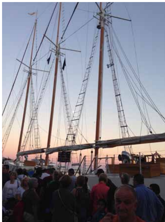
Tłum oczekujących na wejście na „piracki żaglowiec”

starczyło miejsc. Względny bezpieczeństwa pasażerów są bezwzględnie przestrzegane. Nabrzeże przy pirsie zostaje puste. Czekamy na miejsce w restauracji i na paradę.