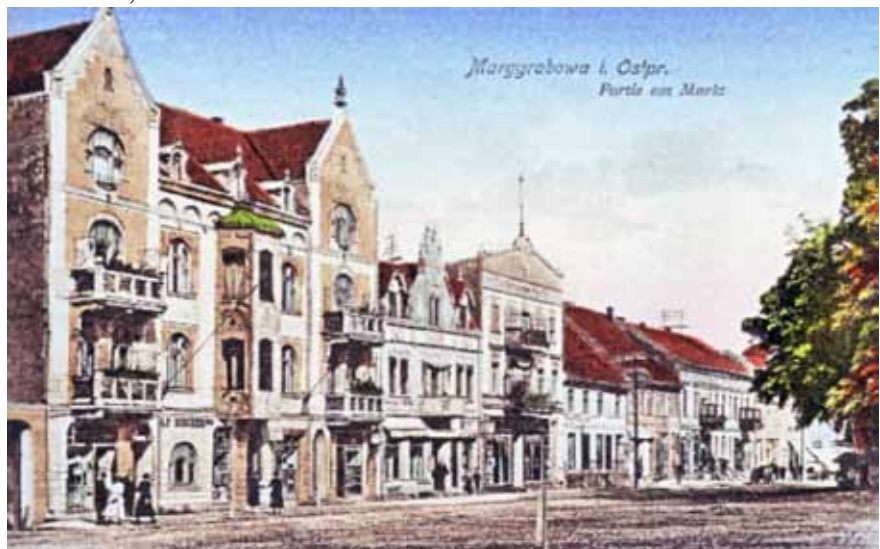
Rynek w Olecku w latach trzydziestych XX wieku.

Opracowanie tekstu i grafiki: J. Kunicki