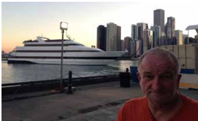
Jacht „Odyssey” dopływa od kei. Robi miejsce dla wieczornej parady

Gdy wreszcie odpływa okazuje się, że nie dla wszystkich