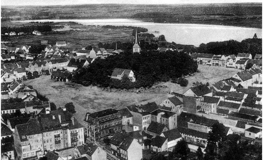
Widok z samolotu na Olecko w 1918 roku