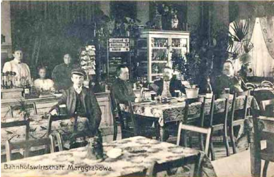
Restauracja na dworcu kolejowym w Olecku w latach trzydziestych XX wieku