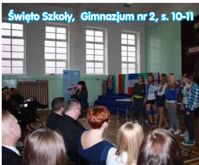
Święto Szkoły, Gimnazjum nr 2, s. 10-11