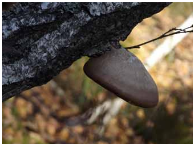
„Jesteśmy razem na dobre i na złe” wyróżnienie - Weronika Drobiszewska 1D