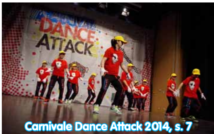
Carnivale Dance Attack 2014, s. 7