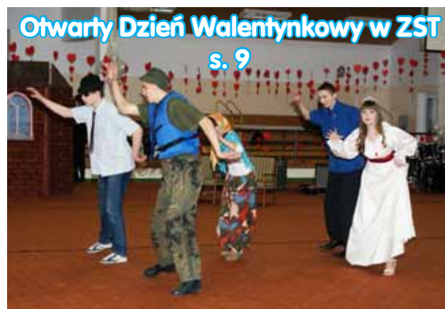
Otwarty Dzień Walentynkowy w ZST s. 9