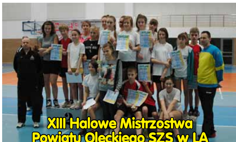
XIII Halowe Mistrzostwa Powiatu Oleckiego SZS w LA szkół podstawowych, na s. 12