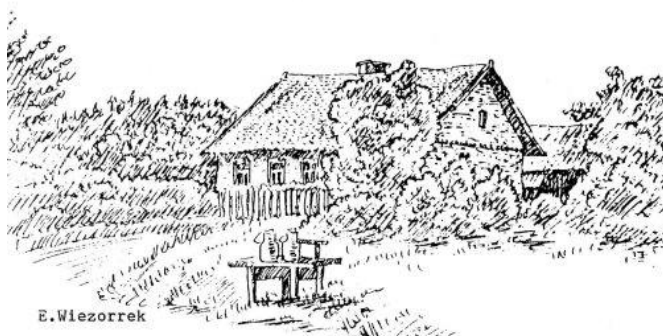
Zagroda Johanna Walendy, rys Erwin Wieszorrek

W domach odnawiano i naprawiano sprzęty. Każdy prawie rolnik potrafił sporządzić kłonicę u wozu, lub żurawia oraz wielu innych rzeczy. Nasz sąsiad „wujek Blasko” znalazł się nawet na wyrabianiu trepeków drewnianych, zwanych także gęsimi tuszkami. Nie były wprowadzane tak eleganckie, jak te kupione w mieście, spełniały jednak należycie swoją funkcję. W niektórych gospodarstwach przedziano jeszcze wełnę lub len, a także zajmowano się tkactwem. Niektóre wyroby (chustki i kołdry) udało się mojej mamie ocalić. Pochodzą od mojej