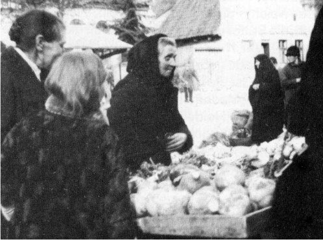
Na rynku w Olecku