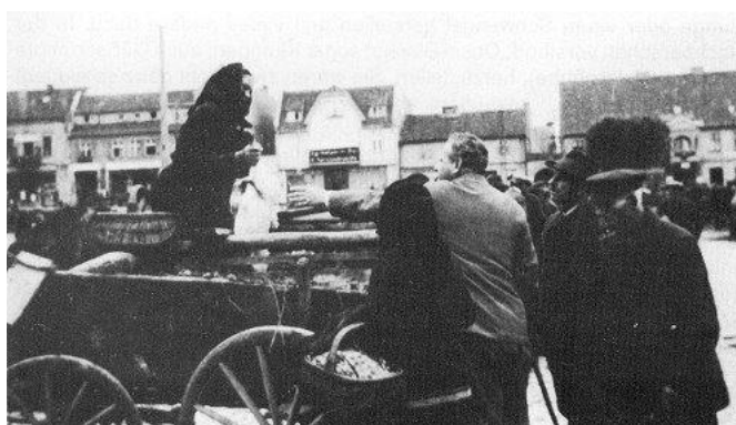
Sprzedaż prosiaków. Od wschodniej strony rynku sklep Alexandrowitz, Drossel i apteka Adler.

Czas wakacji był także czasem żniw, więc potrzebna była każda para rąk do pracy. W zasadzie wakacje przypadały na okres żniw żyta.