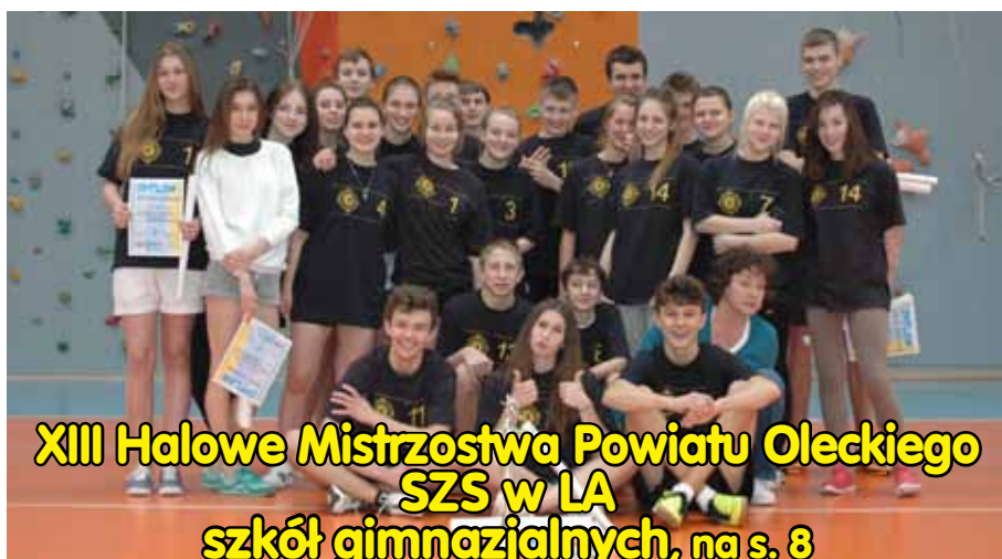
XIII Halowe Mistrzostwa Powiatu Oleckiego SZS w LA szkół gimnazjalnych, na s. 8