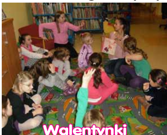
Walentynki w bibliotece, s. 16

Akademia Tańca PERFORMANCE FLOW 21-23 lutego 2014 r. warsztaty: high hills hip hop new style old school jazz tańiec współczesny house udział w warsztatach 50 zł wystąpią: Szał SFC Chu Ciachu Blue Sky szczęgólny s. 4 pokaz finałowy: 23 lutego 2014 r. godz. 19:00 sala kina "Mazur", wstęp: 10 zł