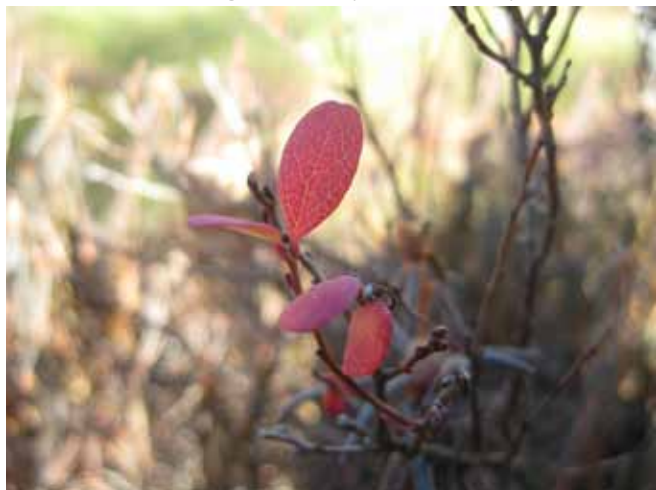
„Jesienne barwy parku” I miejsce - Zuzanna Bubrowska 2B