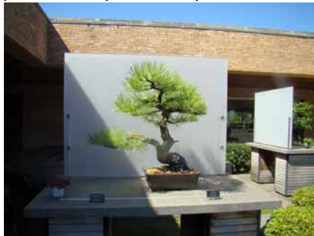
bonsai z chicagowskiego ogrodu botanicznego