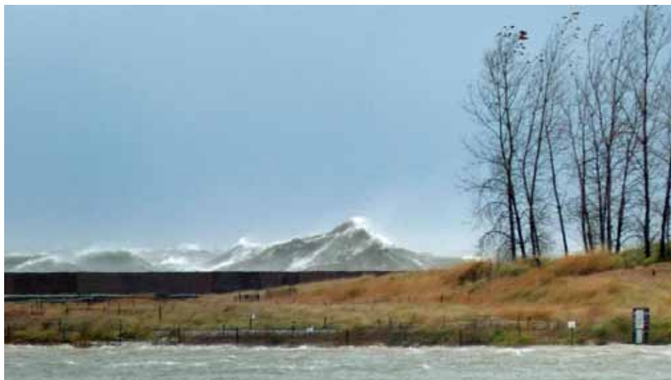
sztorm na Michigan