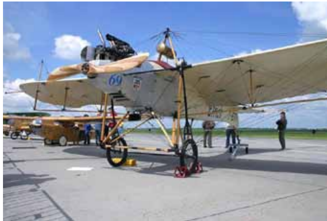
Zdjęcia przedstawiają replikę samolotu Etrich Taube, która lata jako samolot cywilny biorący udział w licznych pokazach lotniczych. Samolot zarejestrowany jest w Niemczech pod symbolem D-ETRI