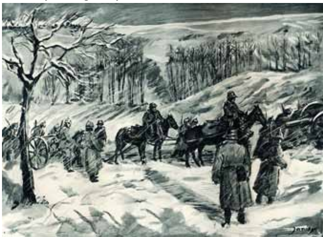
Niemiecka artyleria średnia w warunkach zimowych. obraz olejny

Należy dodać, że długość kolumny rosyjskiej wynosiła około 18 km. Nic więc dziwnego, że podczas nocnego odwrotu panował kompletny chaos. W jakim takim porządku maszerowały oddziały straży przedniej, ale jeden z jej pułków zmylił drogę i wyszedł na Niemców.