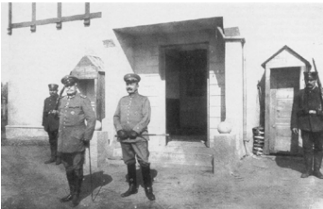
Margrabowa. Kwatera dowódcy X Armii niemieckiej feldmarszałak von Eichhorna. Feldmarszałek w oficerem sztabu.

schall Paul von Hindenburg z szefem sztabu generałem Ludendorffem oraz Friedrich August III von Sachsen .