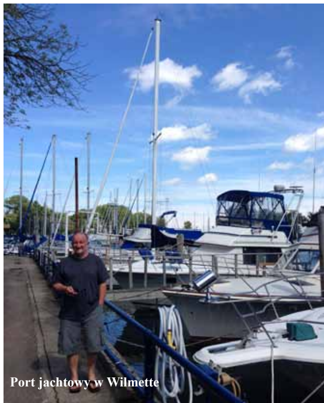
Port jachtowy w Wilmette

Gdy pochwaliłem się zaobserwowaniem nowego zwierzęcia córce, ta powiedziała, że jeszcze nie widziała kolibra w jej ogrodzie. Jednak przyroda wielkiego miasta nie powiedziała mi jeszcze ostatniego słowa. Kilka dni później, w biały dzień znowu przyleciał koliber. Tym razem przez co najmniej trzy minuty buszował po kwiatkach i w końcu, gdy napatrzyłem się do woli, odleciał.