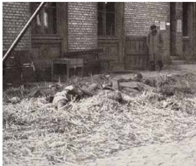
Prowizoryczny szpital żołnierzy rosyjskich. Ranni ułożeni na słomie wzdłuż krawężników ulicy.

Ugrupowanie niemieckie, które wdarło się w 50-kilometrową lukę między 10. i 12. Armią rosyjską, 17 lutego dociera do twierdzy Osowiec.