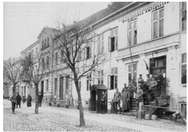
Komendantura wojskowa w Margrabowej

W kwaterze w Olecku przebywał także Generalfeldmar-