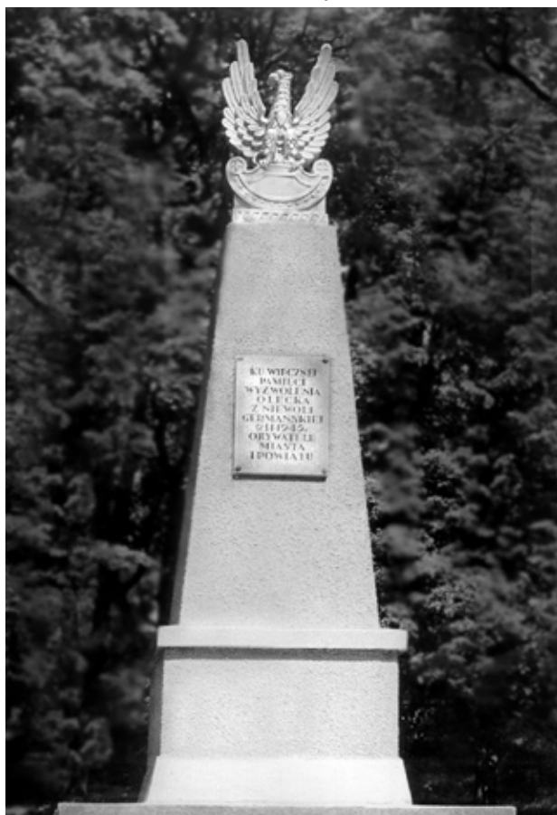
Nieistniejący już dzisiaj pomnik przy Rynku miejskim.