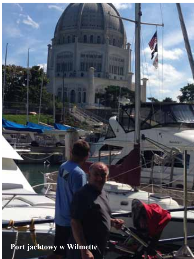
Port jachtowy w Wilmette

Przyleciałem do Stanów w tzw. brekach, czyli wysokich zamiszowych butach. Teraz cały czas chodzę w japonkach. Zresztą tak jak wszyscy. Najpospolitsze obuwie to japonki i sandały. Sandałów nie mam, a są znacznie wygodniejsze. Skręcamy więc z autostrady i parkujemy przed niedużym, jak na warunki amerykańskie, sklepem.