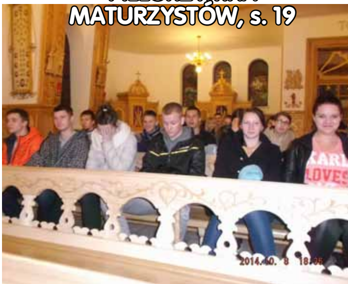
PIELGRZYMKA MATURZYSTÓW, s. 19