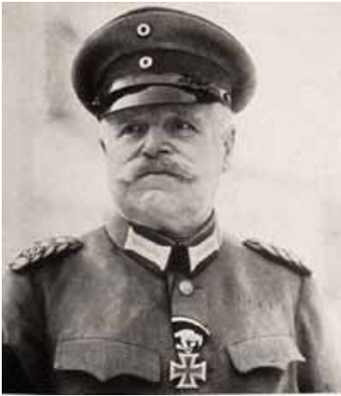
Niemiecki feldmarszałek Hermann von Eichhorn.

6 marca 1915 do Olecka zostaje przeniesiona Kwatera Główna X Armii.