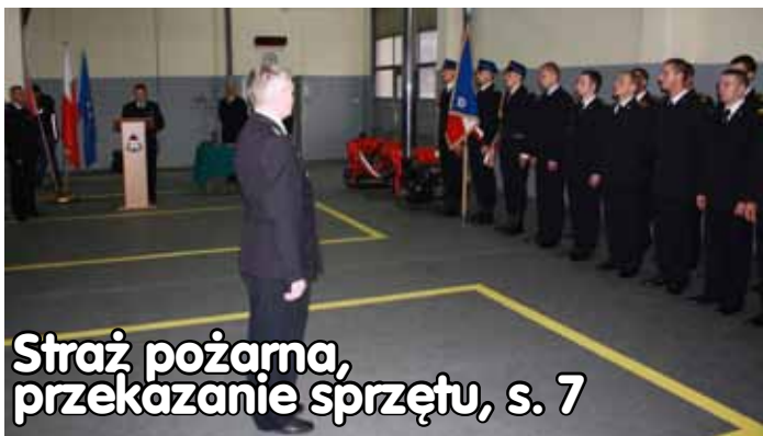
Straż pożarna, przekazanie sprzętu, s. 7