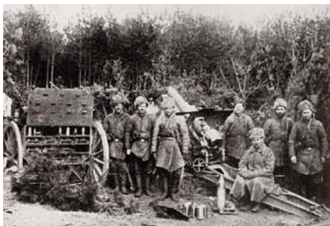
Rosyjska pozycja dział 152 mm stosowanych również w marynarce wojennej, tylko na innego typu lawetach

Komunikacje armii opierają się na czterech liniach kolejowych: Kowno - Wierzbołowo, Grodno - Suwałki, Orany - Olita - Suwałki i Białystok - Grajewo. Z nich tylko linia Grodno - Suwałki i Olita - Suwałki służą dla zaopatrzenia głównych sił armii.