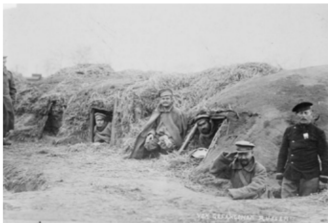
Ziemiarki w okopach rosyjskich

Nastrój oddziałów wskutek przemęczenia nieustannymi pracami i trudnymi warunkami życia w źle zbudowanych okopach jest fatalny. Często zdarzają się wypadki poddawania się do niewoli, dezercji, samouszkodzeń i ucieczek z pola walki.