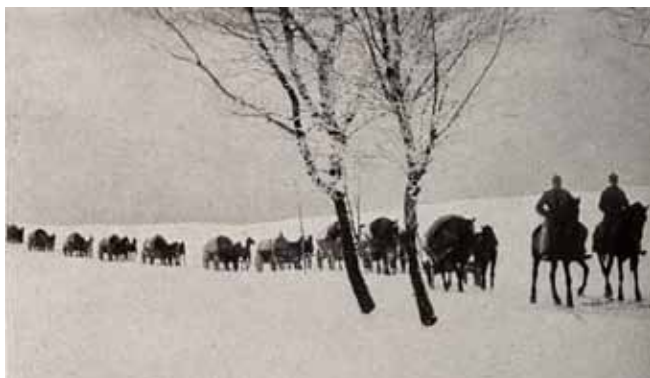
Kolumna cywilnych uciekinierów eskortowana przez żandarmów

Rosyjskie natarcie zatrzymuje się na linii Wielkich Jezior Mazurskich. 10 armia rosyjska generała Siewersa w składzie: 11 dywizji piechoty, 2 dywizji kawalerii i samodzielnej brygady kawalerii zajmuje pozycje na 160 kilometrowym odcinku frontu. Naprzeciwko niej pozycje zajmuje 10 armia niemiecka: 6 i pół dywizji piechoty oraz 1 dywizja kawalerii.