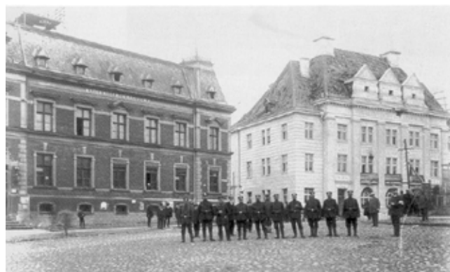
Jedno z najbardziej znanych olecczanom zdjęć z okresu I wojny światowej. Żołnierze landwehry pozują przed budynkiem poczty na rynku więksim w Margrabowej. W głębi budynek, z którego została tylko część z ostami dwoma oknami.

Uderzenie to miało iść wzdłuż rzeki Niemen i południowej granicy Prus Wschodnich.