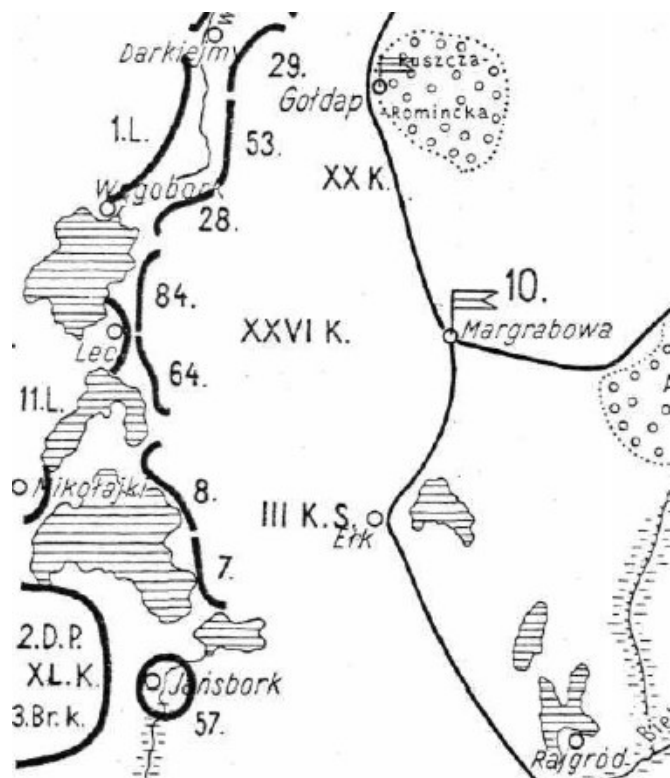
Mapa pokazująca pozycje wojsk rosyjskich i niemieckich z zaznaczeniem miejsca stacjonowania sztabu rosyjskiej 10 Armii

Od dwóch miesięcy armia rosyjska w zasadzie biernie trzyma swój odcinek frontu. Działalność wojsk polega na pozycyjnych walkach; zbliżanie się podkopem do stanowisk niemieckich jest jedynym wyrazem aktywności. Prace wykonywane są wyłącznie nocami, ludzie są przemęczeni.