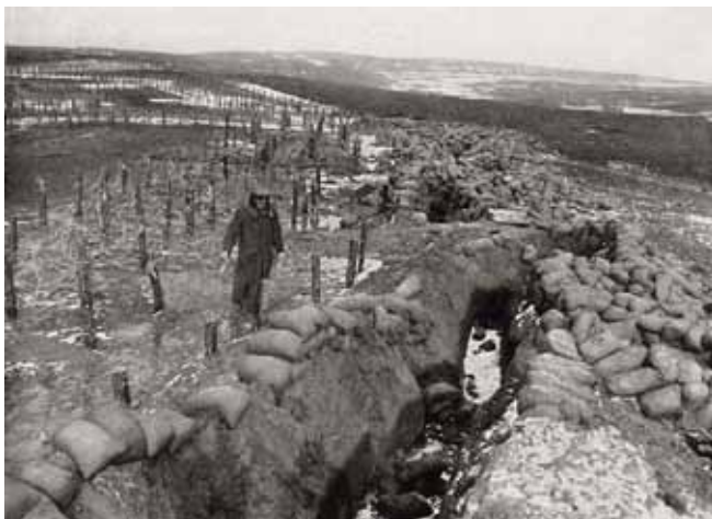
Okopy wojsk rosyjskich

Na początku stycznia 1915 roku Rosjanie dysponowali od Niemna po Karpaty 103 dywizjami i mieli przewagę liczebną nad Niemcami i Austro-Węgrami, którzy posiadali