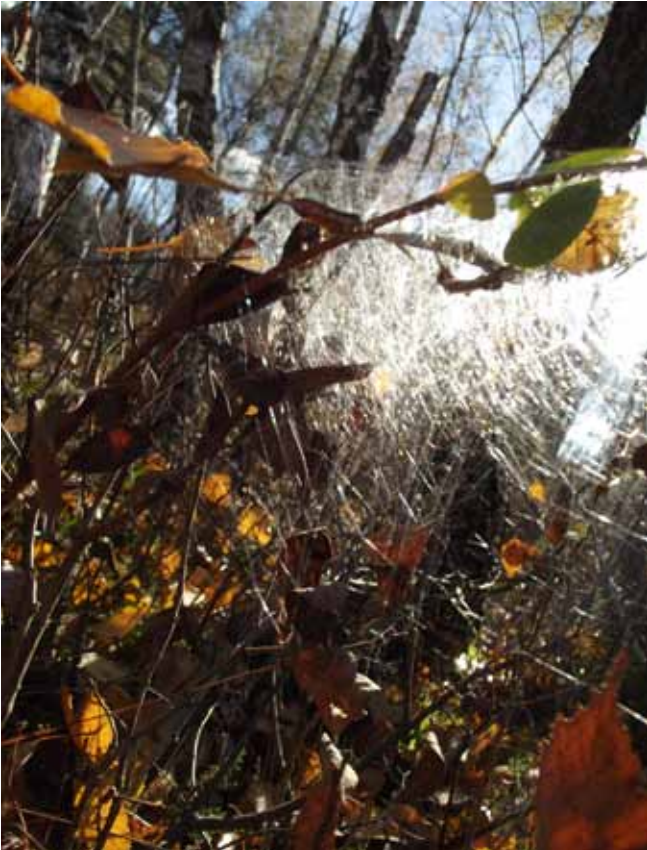
„W pajęczej sieci” wyróżnienie - Weronika Drobiszewska 1d