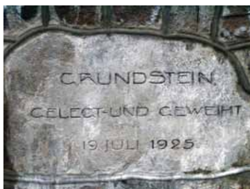
kamień węgielny położony i poświęcony 19 lipca 1925

Herr Gott, erhöre unser Flehn, lass wieder ein starkes Deutschland estehen Panie Boże, usłysz nasze błagania i spraw, żeby znowu powstały silne Niemcy.