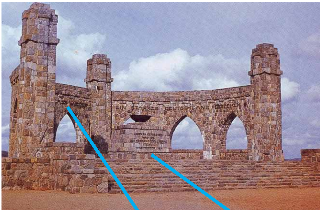
Pomnik zbudowano w latach 1926 - 1927. Ma 20 metrów w najszerszym miejscu i 10 metrów wysokości.