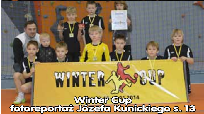
Winter Cup fotoreportaż Józefa Kunickiego s. 13

KADR – nowy cykl filmowy kina „Mazur” w Olecku s. 7