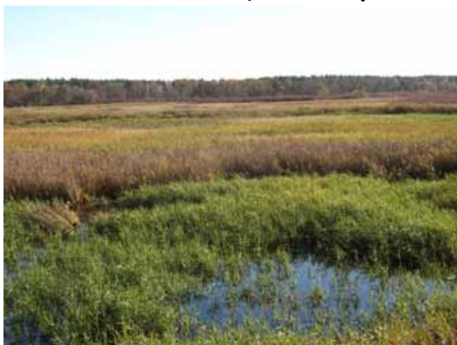
„Mimozami jesień się zaczyna” III miejsce - Maciej Marchewka 1d