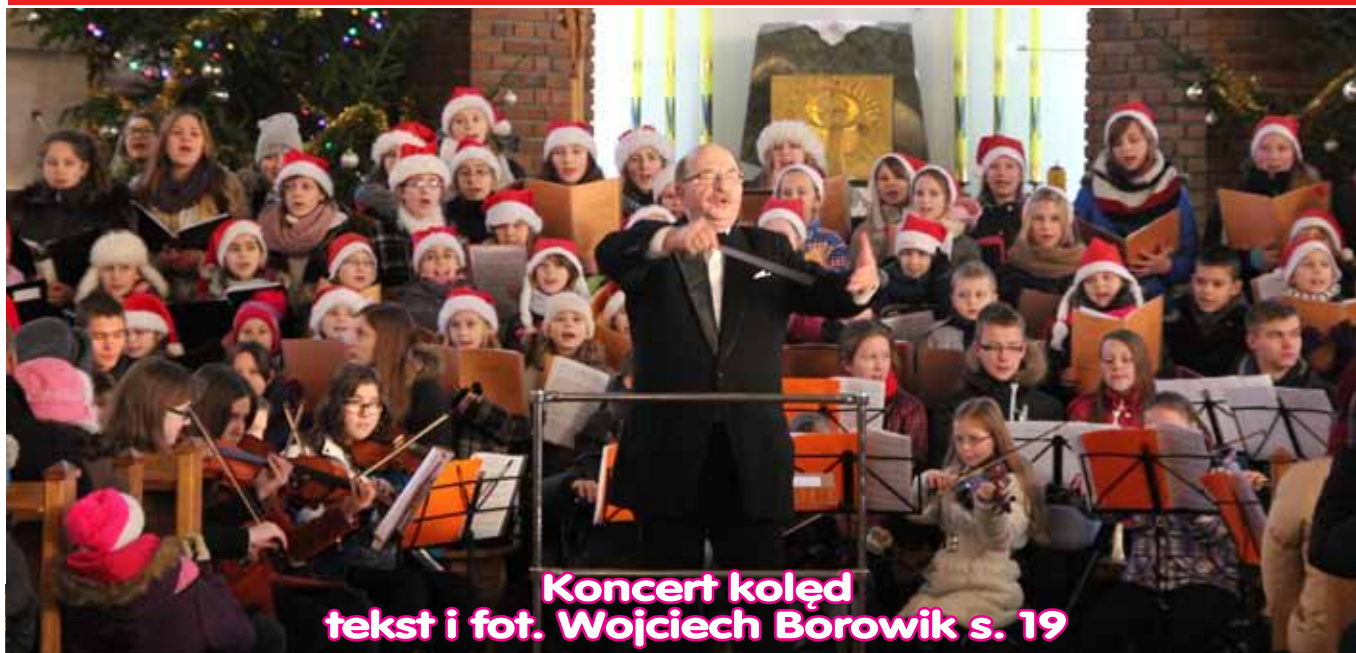
Koncert kolęd tekst i fot. Wojciech Borowik s. 19