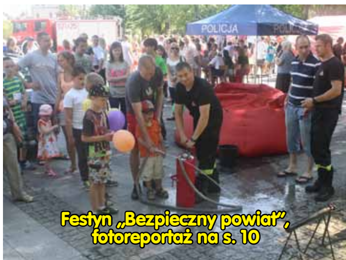
Festyn „Bezpieczny powiat”, fotoreportaż na s. 10