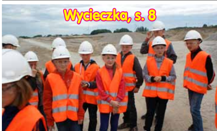
Wycieczka, s. 8