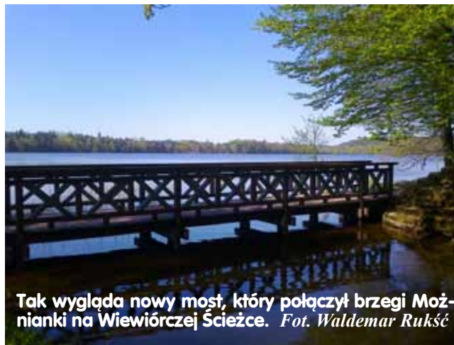
Tak wygląda nowy most, który połączył brzegi Moźnianki na Wiewiórczej Ścieżce.

Podczas spektaklu panie bawią się wyśmienicie – także te na widowni. I panowie ze zdumieniem stwierdzają, że coraz śmielej klaszczą i śpiewają ze wszystkimi. To prawdziwa terapia śmiechem - kojąca i skuteczna - pod jej wpływem nabieramy dystansu do siebie, innych, naszych zranień i lęków. Bo „Menopauzy szal” ogarnia wszystkich, a zwłaszcza tych, którzy się tego zupełnie nie spodziewają.