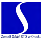
Zespół Szkół STO w Olecku