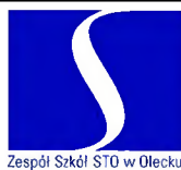
Zespół Szkół STO w Olecku