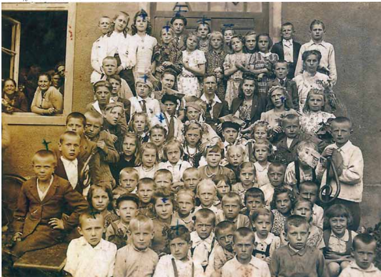
Dzieci dorośli przed świetlicą wiejską (1947-1948)