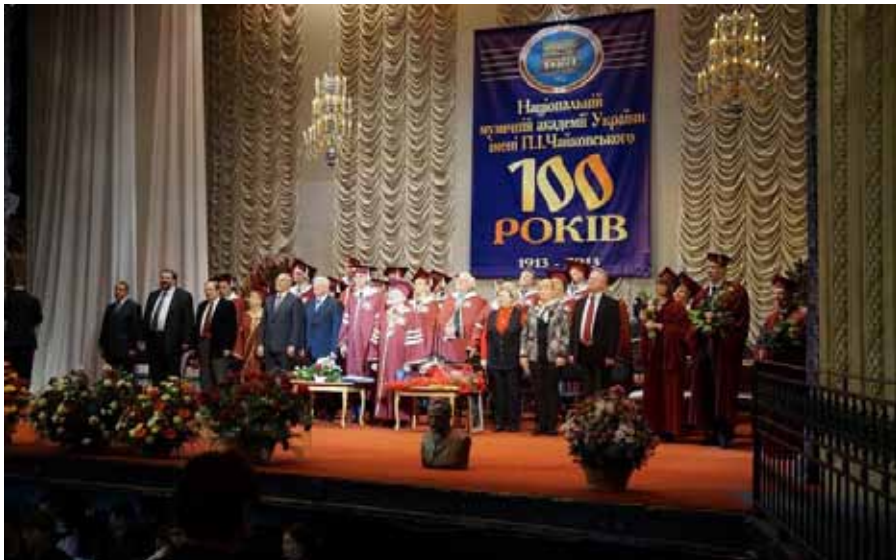
Sala Koncertowa Akademii Kijowskiej podczas uroczystości 100-lecia uczelni.