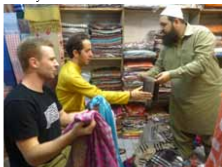
Z panem „Dobra cena dla turysta”

Czwartek, środek dnia, niesamowity żar łał się z nieba. W centrum Karachi olbrzymi korek uliczny. Wszędzie mnóstwo motocykli, samochodów i oczywiście motoriksów. Pomiedzy nimi kilku obcokrajowców starających się dostać się na lokalny bazar. Plan był prosty. Dotrzeć na miejsce jak najszybciej, kupić unikatowe rzeczy, nie dać wrobić się w „special price for you”, opuścić bazar i zdążyć na kolacje. Jak zwykle jednak okazało się, że najbardziej oczywistym elementem planów okazały się zmiany.