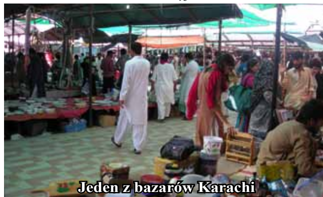
Jeden z bazarów Karachi

Zatrzymaliśmy się przy potężnym gmachu urzędu miasta. Pośpiesznie przemierzaliśmy zabytkowe uliczki z czasów brytyjskiego imperializmu. Dotarliśmy do naszego nieplanowanego celu. Nowoczesne centrum handlowe jakby niepasujące do otoczenia. Wy różniło się czystością i blaskiem, co jest standardem w europejskich galeriach. Jedyni dobrze uzbrojeni ochrona przypominała, że nadal znajdujemy