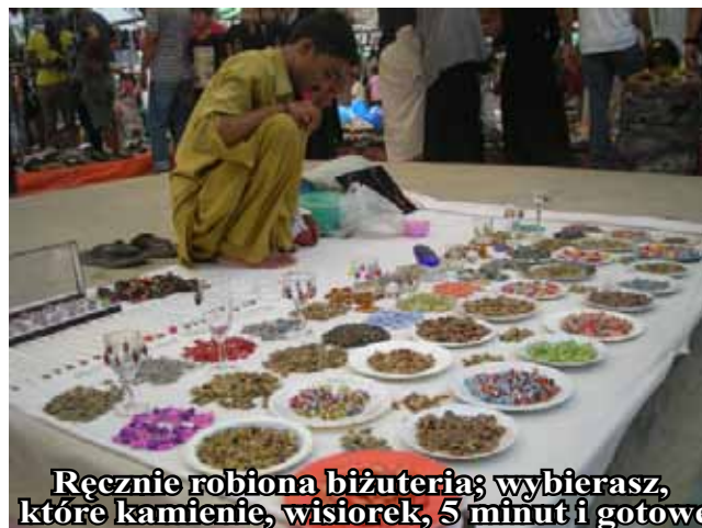
Ręcznie robiona biżuteria; wybierasz, które kamienie, wisiorek, 5 minut i gotowe