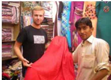
Prezentacja materiału na Shalwar Kameez

się w Pakistanie. Oczywiście w sklepach ceny były odpowiednie. Dorównywały niemalże zachodnim. Wiele marek było znanych.