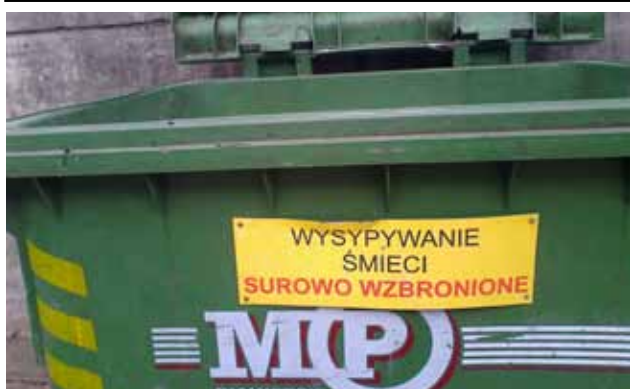
Bez komentarza!

W holu kina „Mazur” będzie można obejrzeć wystawę zdjęć dokumentujących działania w projekcie „Wszyscy równi, wszyscy różni”.