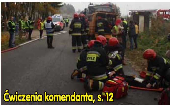
Ćwiczenia komendanta, s. 12