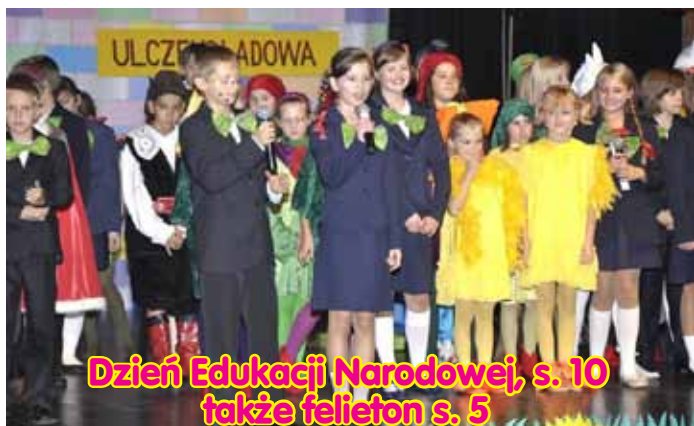
Dzień Edukacji Narodowej, s. 10 także felieton s. 5