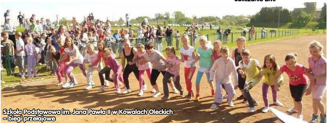
Szkoła Podstawowa im. Jana Pawła II w Kowalich Oleckich – biegi przelajowe