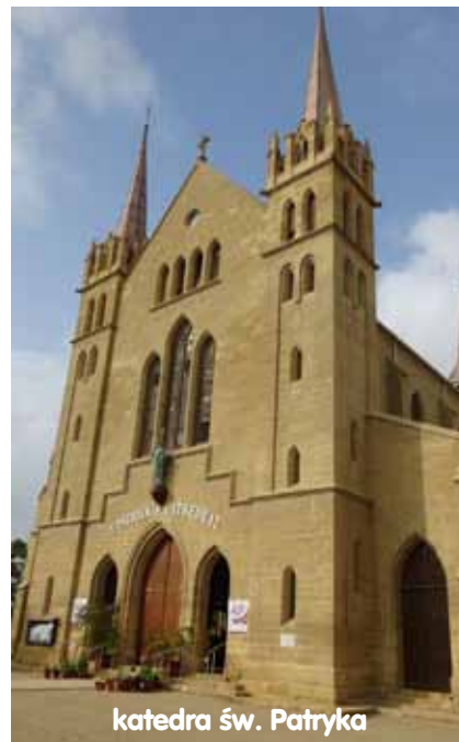
katedra św. Patryka

Szariat i Jihad również często przytaczane, mogą kojarzyć się ze świętą wojną przeciwko władzy politycznej, przeciwko chrześcijanom, przeciwko niewiernym. Jest