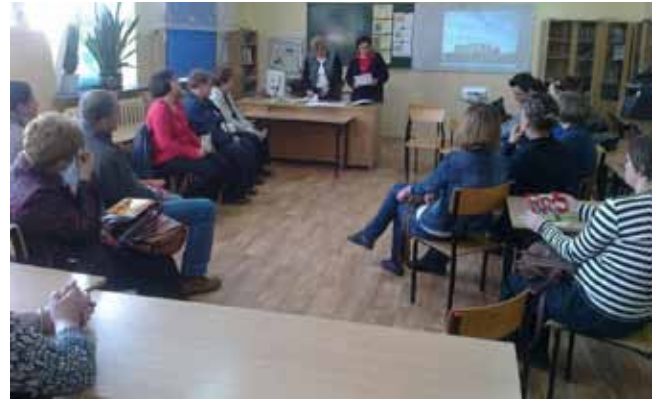
Szkoła Podstawowa w Wieliczkach - „Sól szkodzi zdrowiu” – zebranie z rodzicami uczniów

Powiatowa Stacja Sanitarно-Epidemiologiczna w Olecku