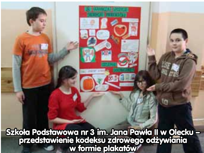
Szkoła Podstawowa nr 3 im. Jana Pawła II w Olecku – przedstawienie kodeksu zdrowego odżywiania w formie plakatów