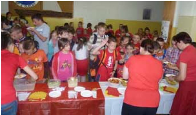
Zespół Szkół w Olecku – „Dzień sałatkowy”