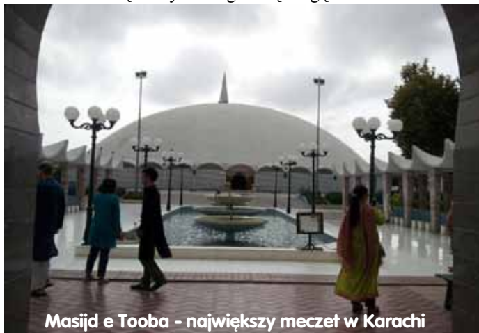
Masjid e Tooba - największy meczet w Karachi