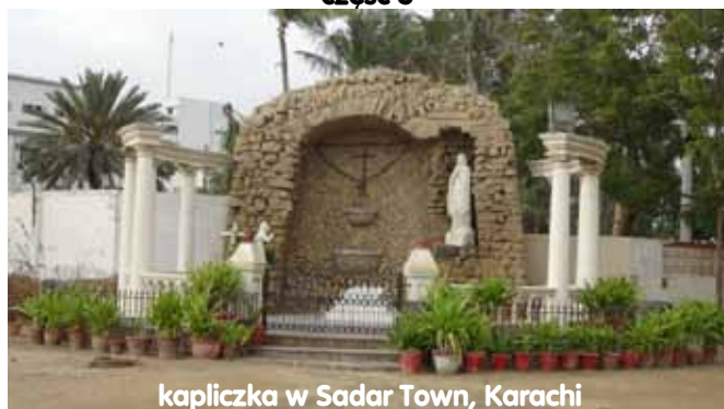
kapliczka w Sadar Town, Karachi