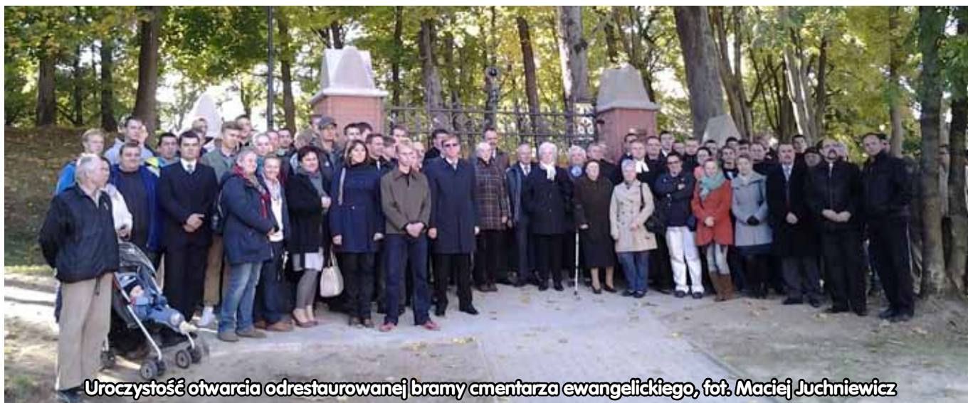
Uroczystość otwarcia odrestaurowanej bramy ementarza ewangelickiego