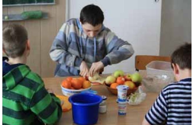
Szkoła Podstawowa w Stożnem – przygotowywanie sałatek i kanapek