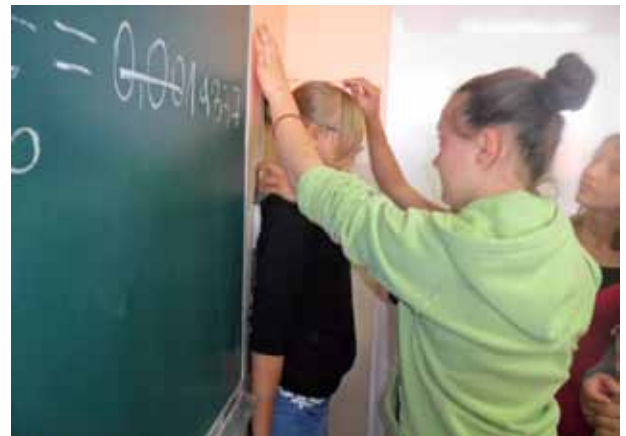
Zespół Szkolno-Przedszkolny w Cimochach – obliczanie BMI