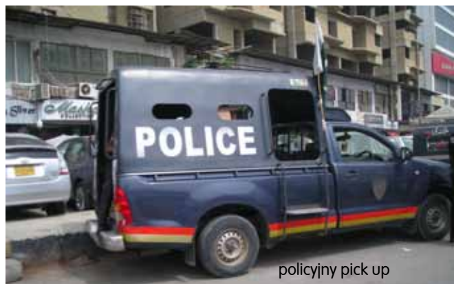
policyjny pick up