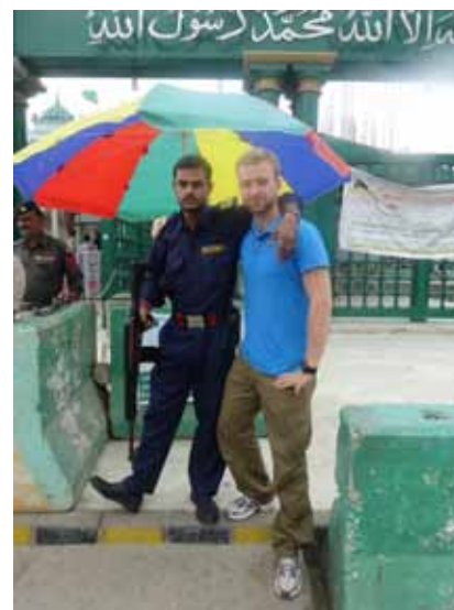
z lokalnym ochroniarzem z firmy o błyskotliwej nazwie Internet

Dystans pięciu tysięcy kilometrów pomiędzy Polską, a Pakistanem jest oczywistym powodem wielu różnic kulturowych. Jednakże są to różnice, które nie przynoszą problemów, a wyzwania i możliwości odkrywania, również samego siebie.