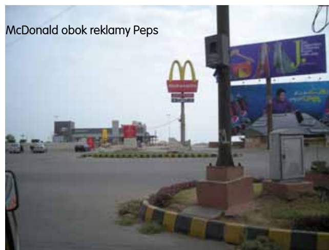
McDonald obok reklamy Peps