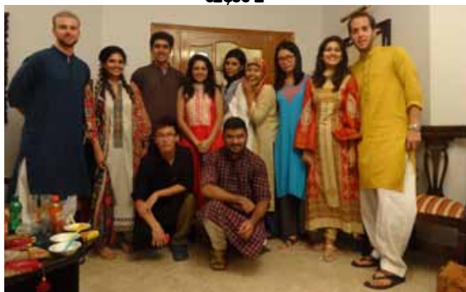
Zwykły dzień w niezwykłym shalwar kameez