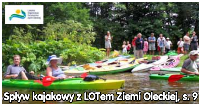
Spływ kajakowy z LOTem Ziemi Oleckiej, s. 9